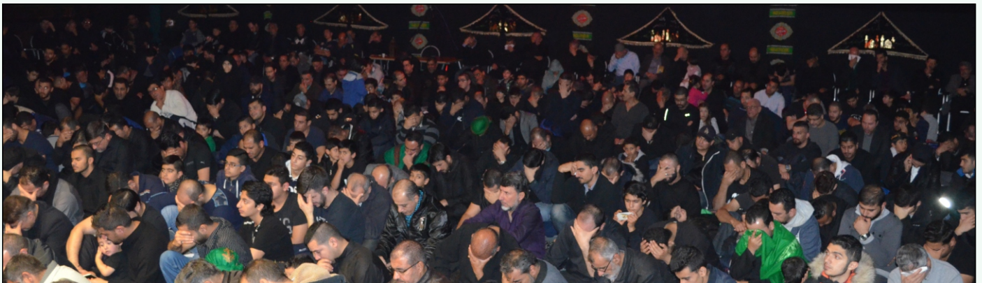
مجالس عاشوراء داخل المركز