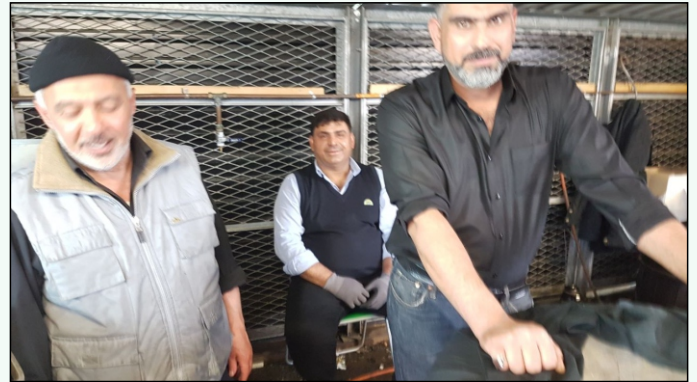
التنسيق مع المطبخ حاجة