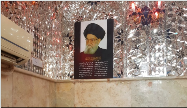
هنا دفن الراحل في مسجد الشاكري. الصورة لمراسل " أخبار المركز" خلال زيارته للنجف الأشرف.

وأضاف سماحته: صحيح أن هناك سبباً للنزول لكن الآية لا تختص بالسبب. بل إن كل الناس سيأتون فرادى كما خلقوا، وكل الناس سيتركون وراء ظهورهم ما كانوا يحملون. وكذلك لن يكون لآلهة الشرك نصيباً من الشفاعة التي خص الله بها بعضاً من أوليائه.