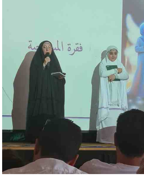
الحاجة أم أمير مخرجة المسرحية