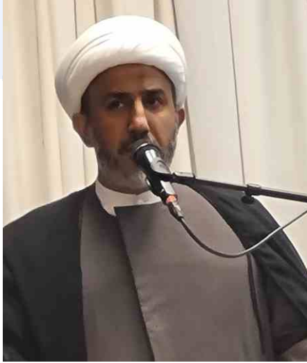
الشيخ علي الفضلي

بنفسم بحثي إلى محاور ثلاثة: المحور الأول يتكلم حول الولادة، والمحور الثاني وقفة مع كلمة، والمحور الثالث تحليل لموقف أطلقه إمامنا سلام الله عليه. المحور الأول الملاحظ لولادة الإمام الرضا سلام الله عليه يجد أن هذه الولادة كان ولادة متميزة، ولادة خطط لها الوحي، وخططت لها السماء. ففي ولادات جميع الأئمة عليهم السلام هناك إرادة إلهية في اختيار الأم واختيار البيئة، وعليه فإننا نرى أن هناك تدخلاً كبيراً من الوحي في ولادة الإمام الرضا (ع). يروي الشيخ الصدوق في "عيون أخبار الرضا" بعض الأخبار حول ولادة الرضا (ع).