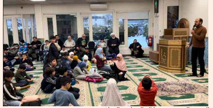
السيد الموسوي خلال البرنامج الثقافي

(ص). فالعمل المسرحي مفيد جدا سواء للمشاهد او للممثل".