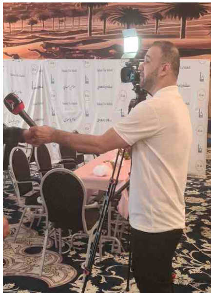
مراسل قناة كربلاء الفضائية في تغطية للحدث

"فبلوغ الابناء والبنات سن التكليف الإلهي هو مرحلة انتقالية يدخل معها هؤلاء في حياة جديدة بمسؤوليات وتطلعات وأحاسيس جديدة". هذا ما قاله أحد مسؤولي المدرسة، مضيفاً: "هي ولادة جديدة تستحق أن يحتفل بها اولياء الأمور وان تحتفل بها المدرسة والمسجد والحسينية والمركز الاسلامي الذي يحتضن هؤلاء. وما تكريم الذين بلغوا سن التكليف إلا إجراء يسعى لأن يوفى هذا الحدث الجلل بعض حقه ومستحقه".