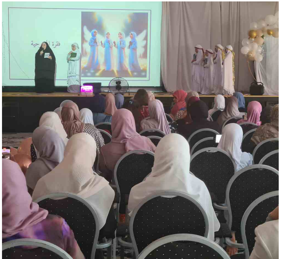
خائب من الحضور النسوي