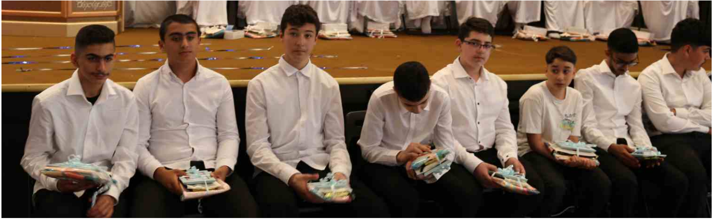
صورة تذكارية للمشاركين

يقول (م.م): أقيم الحفل على ثلاث مراحل: مرحلة التخطيط النظري وتزيين القاعة وتدريب المكلفين على الأدوار التي سوف يؤديونها على المسرح.