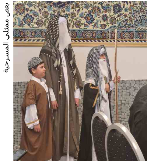
بعض ممثلي المسرحية