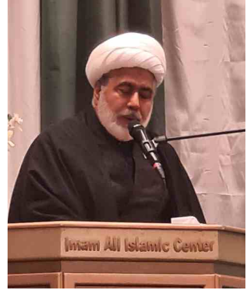
الشيخ حكيم الهي